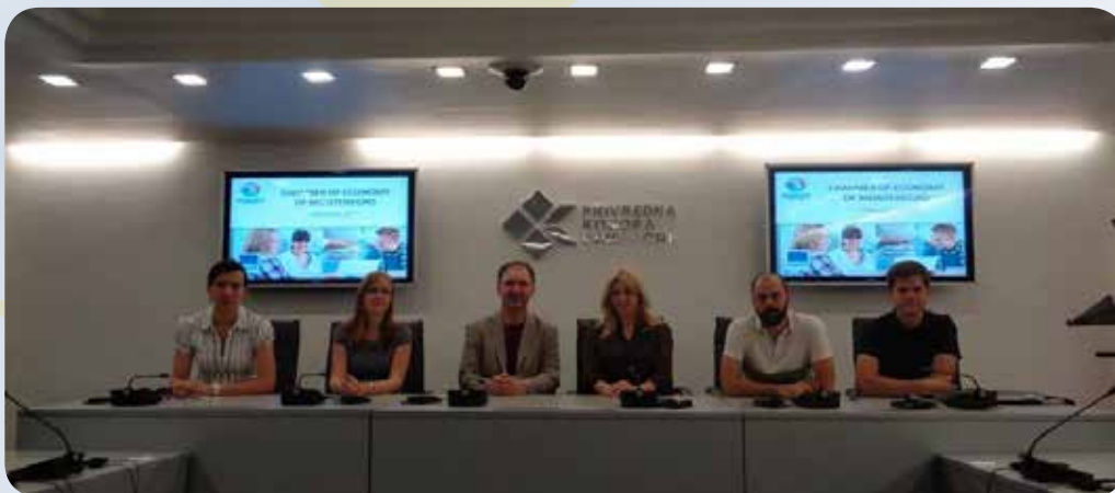
Prezentacija projekta u Privednoj komori Crne Gore

Pokrenut je i šestomjesečni online časopis „ICT bezbjednost za sve“, koji je namijenjen svim građanima Crne Gore. Vodilo se računa da tekstovi budu jasne sadržine, za čije razumijevanje nije potrebno uskospecijalizovano ICT predznanje. Ukupan broj objavljenih časopisa je šest, čiji glavni izdavač je Centar za edukaciju u oblasti sajber bezbjednosti.