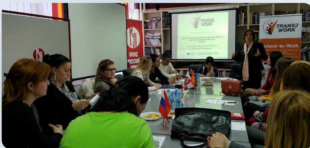
Radionica u Nikšiću, novembar 2016. godine

U međuvremenu, na Univerzitetu Crne Gore realizovane su posebne inicijative, kao i projektne aktivnosti (one se prvenstveno odnose na arhitektonska rješenja za prilaz studenata sa invaliditetom) u cilju podrške studentima sa invaliditetom. U maju 2016. godine organizovana je obuka u okviru projekta čiji je cilj prevazilaženje barijera sa kojima se studenti sa invaliditetom susreću svakog dana. Isto tako, Univerzitet Crne Gore donio je odluku da se studenti sa invaliditetom oslobode plaćanja školarine. U toku je proces uključivanja studenata sa invaliditetom u Studentski parlament Univerziteta Crne Gore, čime se otklanja mogućnost bilo koje vrste diskriminacije. Karijerni centar Univerziteta Crne Gore radi sa svim studentima Univerziteta, pa tako i onima koji su osobe sa invaliditetom, pripremajući ih i povezujući sa potencijalnim poslodavcima. Centar posebno radi na razvoju servisa za unapređenje praktičnih i tzv. mekih vještina kod studenata. Univerzitet Crne Gore je, zajedno sa ostalim univerzitetima u Crnoj Gori, prihvatio deklaraciju o formiranju Studentske savjetodavne kancelarije u julu 2013. godine, koja je sastavni dio Udruženja mladih sa hendikepom Crne Gore.