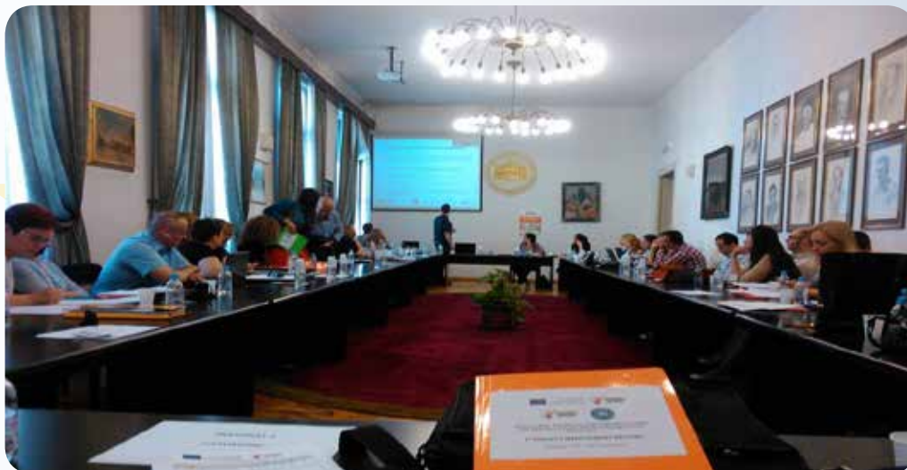
Projektni sastanak u Sarajevu, jun 2016. godine

U međuvremenu, na Univerzitetu Crne Gore realizovane su posebne inicijative, kao i projektne aktivnosti (one se prvenstveno odnose na arhitektonska rješenja za prilaz studenata sa invaliditetom) u cilju podrške studentima sa invaliditetom. U maju 2016. godine organizovana je obuka u okviru projekta čiji je cilj prevazilaženje barijera sa kojima se studenti sa invaliditetom susreću svakog dana. Isto tako, Univerzitet Crne Gore donio je odluku da se studenti sa invaliditetom oslobode plaćanja školarine. U toku je proces uključivanja studenata sa invaliditetom u Studentski parlament Univerziteta Crne Gore, čime se otklanja mogućnost bilo koje vrste diskriminacije. Karijerni centar Univerziteta Crne Gore radi sa svim studentima Univerziteta, pa tako i onima koji su osobe sa invaliditetom, pripremajući ih i povezujući sa potencijalnim poslodavcima. Centar posebno radi na razvoju servisa za unapređenje praktičnih i tzv. mekih vještina kod studenata. Univerzitet Crne Gore je, zajedno sa ostalim univerzitetima u Crnoj Gori, prihvatio deklaraciju o formiranju Studentske savjetodavne kancelarije u julu 2013. godine, koja je sastavni dio Udruženja mladih sa hendikepom Crne Gore.