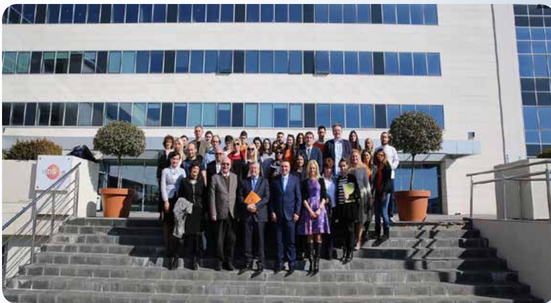
Prvi sastanak projektnog konzorcijuma, Podgorica, 15. februar 2017. godine