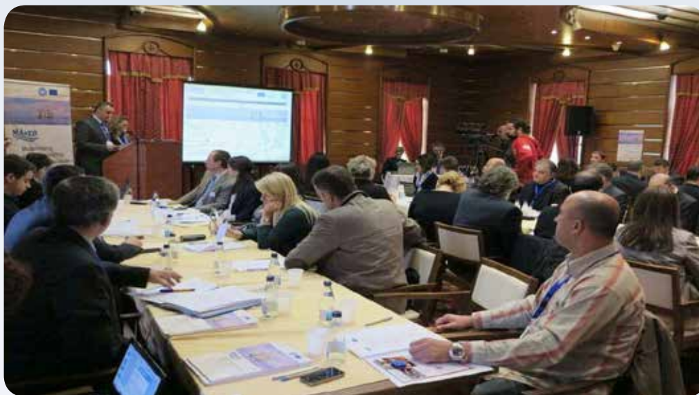
Prvi sastanak projektnog konzorcijuma, Kotor, 21. februar 2014. godine

Realizacija svih projektnih aktivnosti je vidljiva preko web sajta projekta www.mared.ac.me .