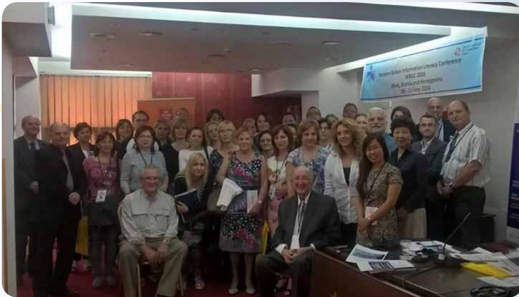
Sastanak partnera u Bijaću, Bosna i Hercegovina, 9. jun 2016. godine